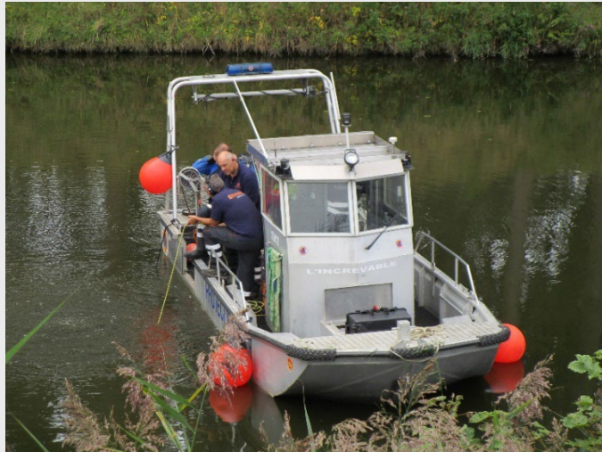
De oudste in gebruik zijnde boot is de 3012, bekend als de Increvable, een platbodem die is ontworpen voor oesterbanken op het eiland Oléron. Het is omgebouwd voor voertuigwinning