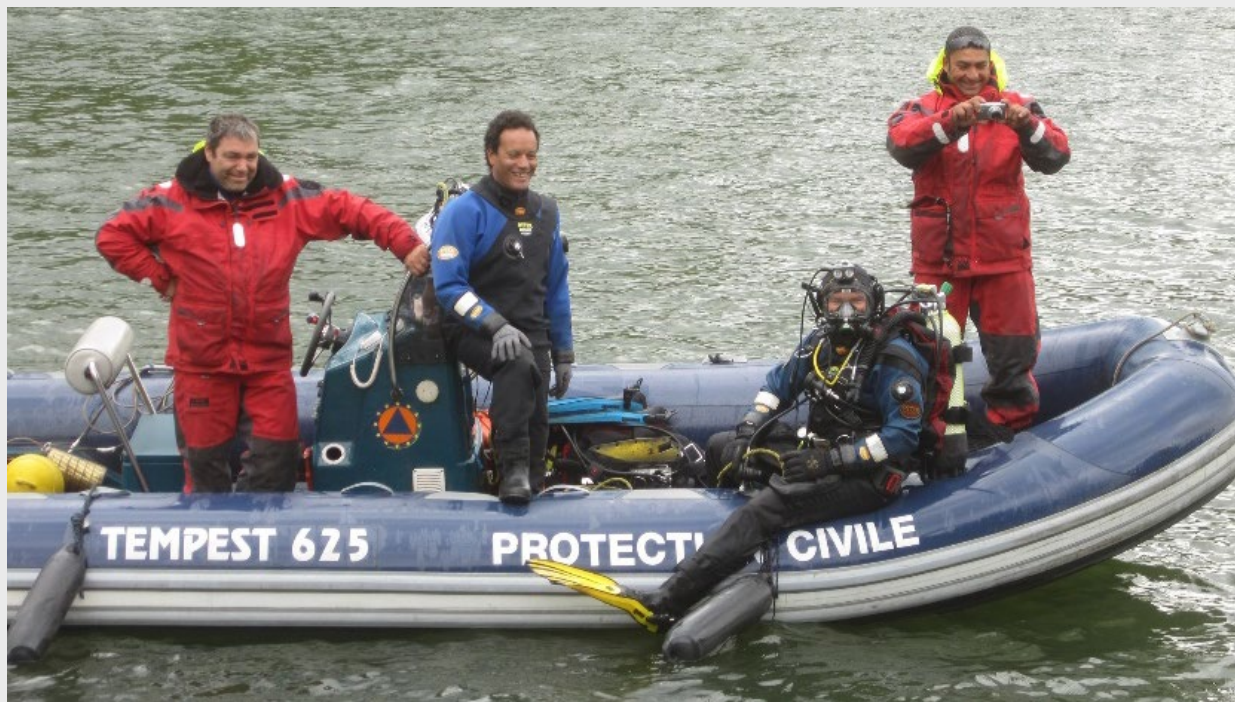
De derde een kleine zodiac met elektrische motor om op vijvers te werken